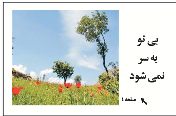
بی تو به سر نمی شود