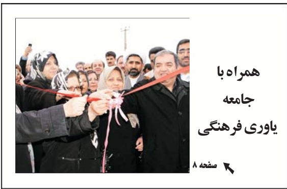
همراه با جامعه یاوری فرهنگی