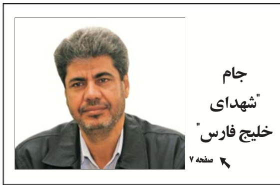
جام "شهادی خلیج فارس"